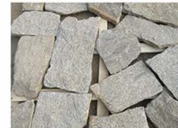
芝麻黄 Sesame Yellow