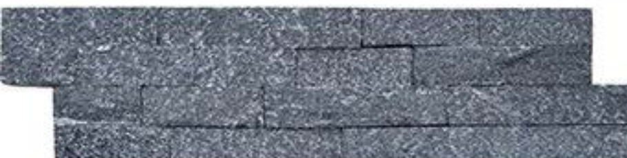
夜皇黑 Black Quartz