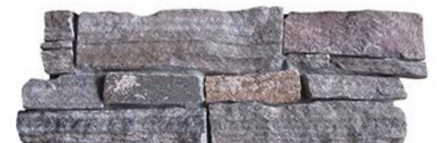
粉石英 Pink Quartz