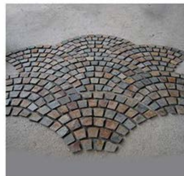
锈色大扇形 Rusty Large fan-shaped