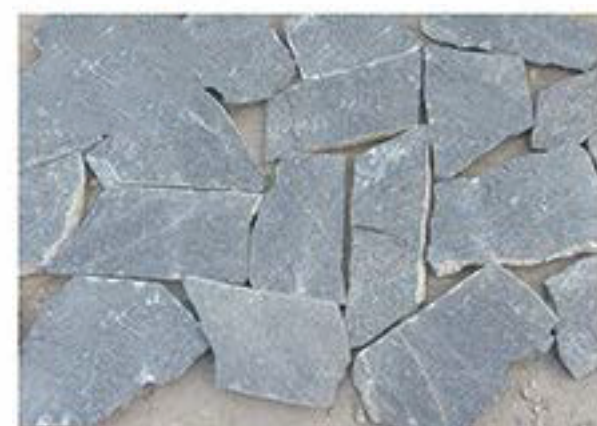
松针黑 Pine Needles Black