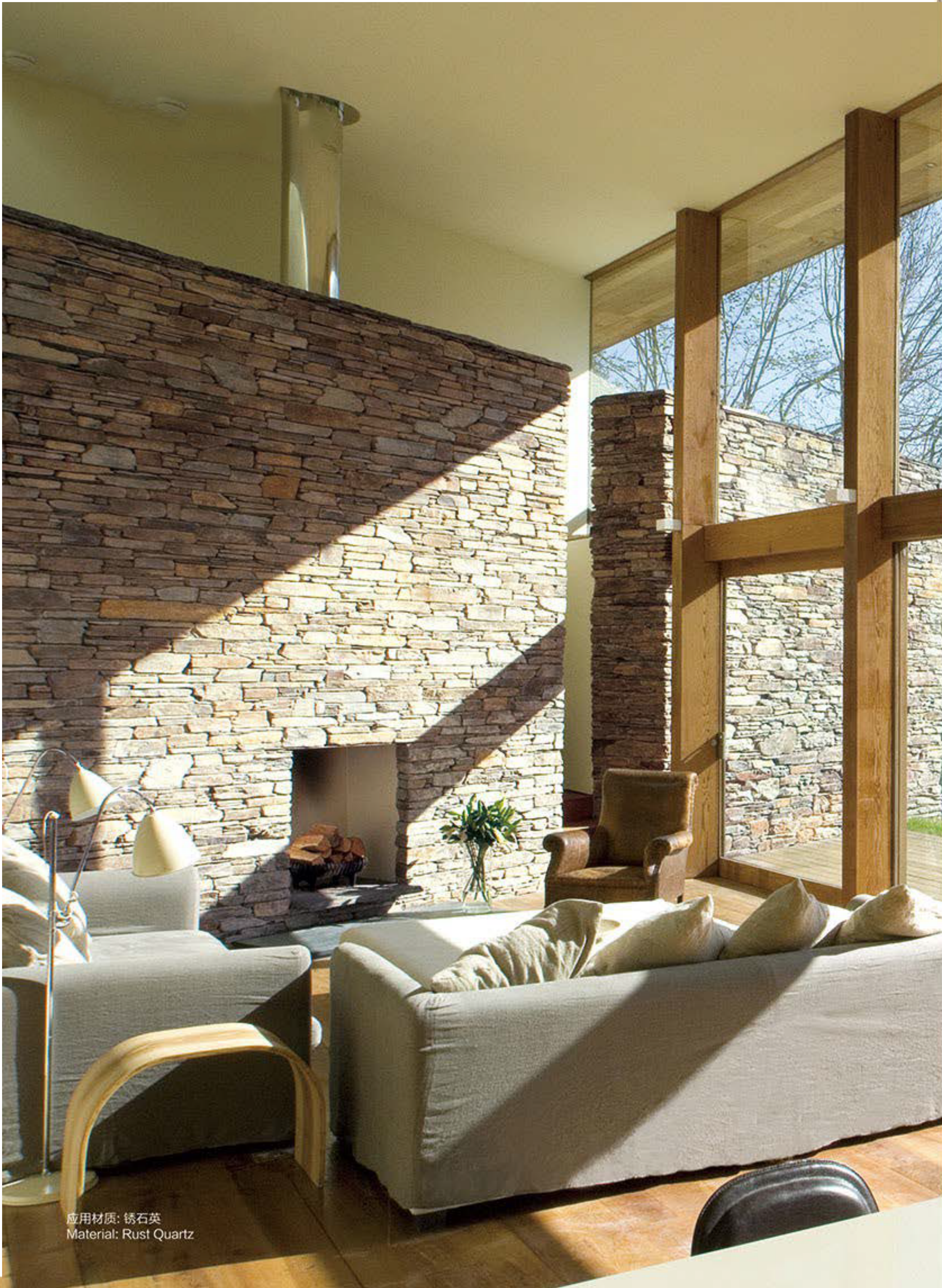
应用材质: 锈石英 Material: Rust Quartz