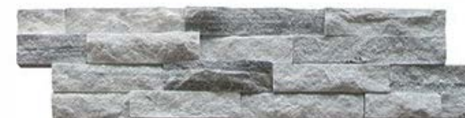
云灰毛边 Cloud Grey