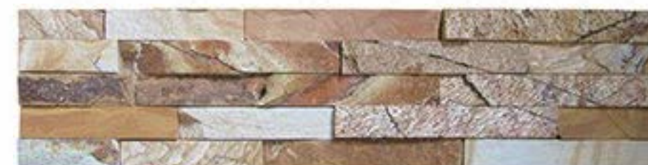
金木纹 Golden Wooden