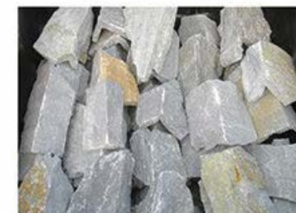
蓝石英 (拐角) Blue Quartz (Corner)