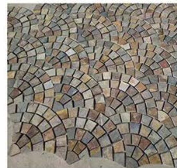
锈色小扇形 Rusty Small fan-shaped