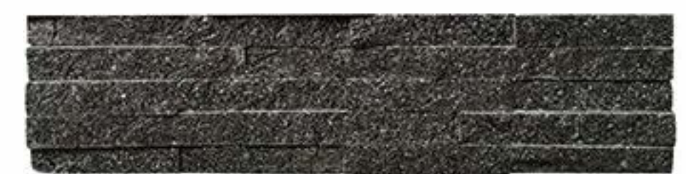
绿金沙 Green Galaxy