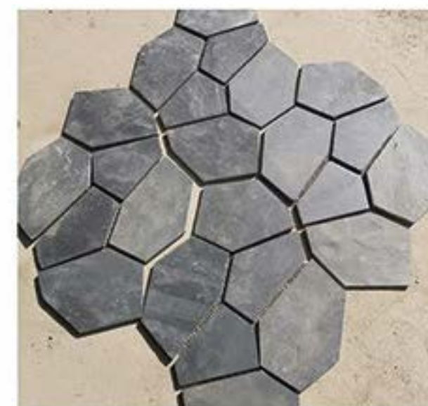
黑色板岩 Black Slate