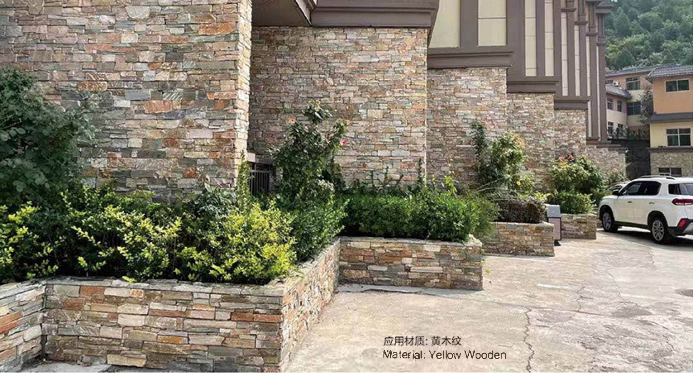
应用材质: 黄木纹 Material: Yellow Wooden