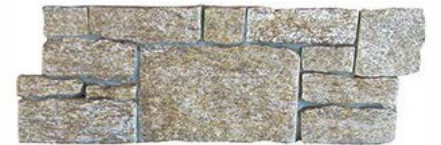
虎皮黄 Tiger Skin Yellow