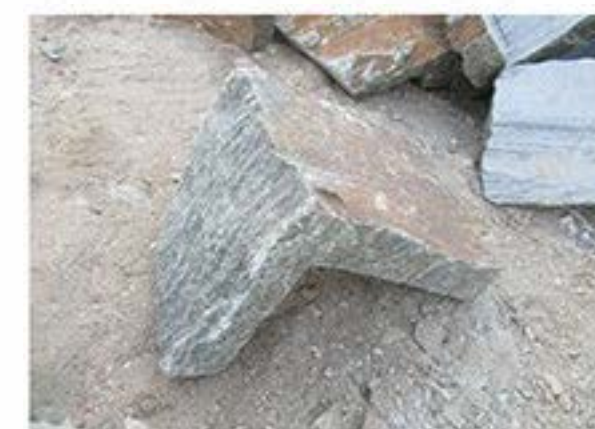
锈石英 (拐角) Rust Quartz(Corner)