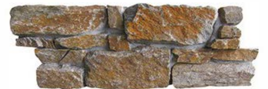
锈石英 Rusty Quartz