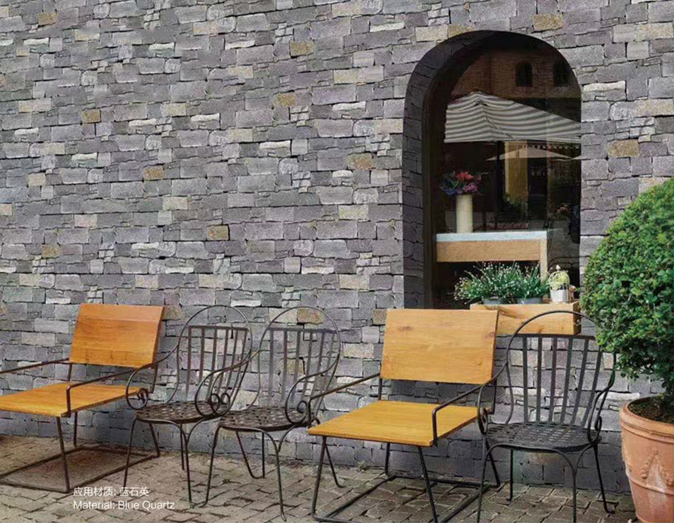
应用材质: 蓝石英 Material: Blue Quartz