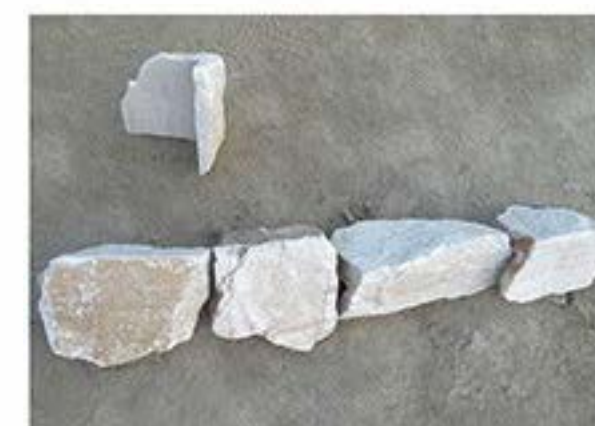
黄白石英 (拐角) Light Yellow Quartz (Corner)