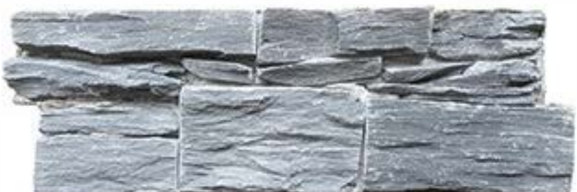
黑板岩 (19) Black 19#