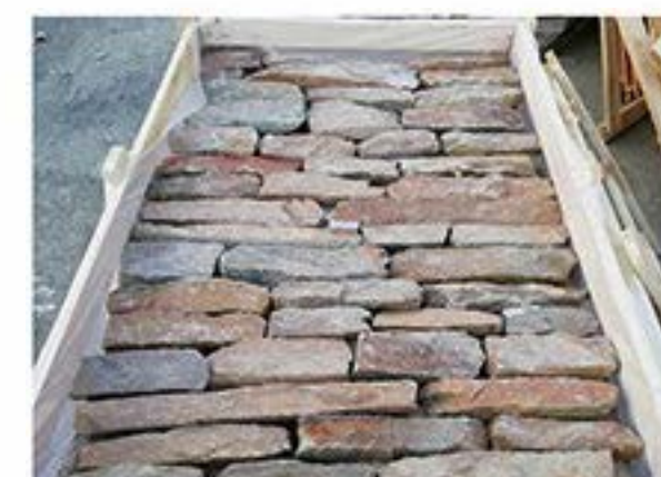
锈石英 Rust Quartz