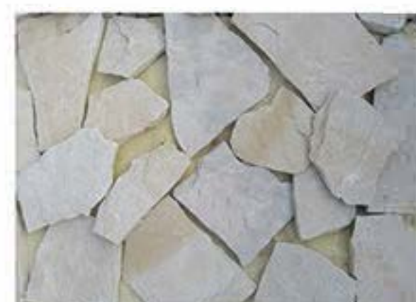
白砂岩 White Sandstone