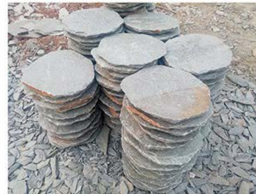
绿石英 Green Quartz