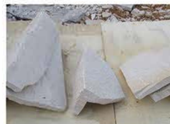
白砂岩 (拐角) White Sandstone (Corner)