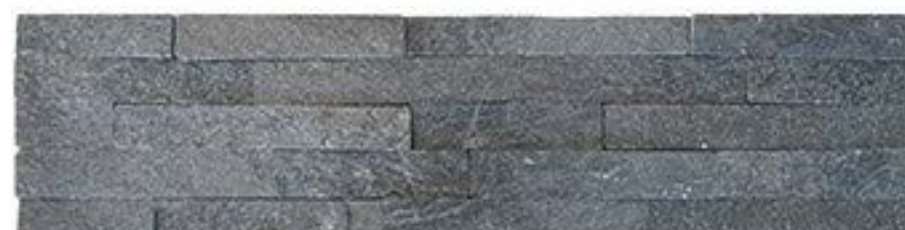
松针黑 Pine Needle Black