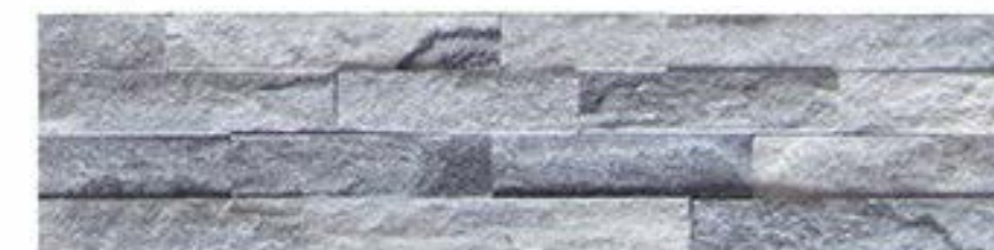
云灰 Cloud Grey