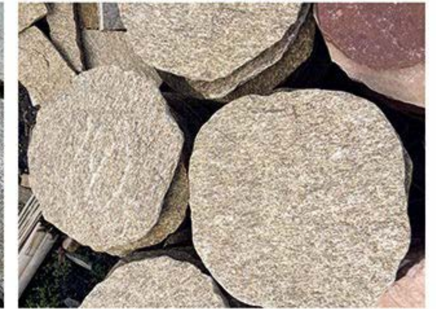
芝麻黄 Sesame Yellow