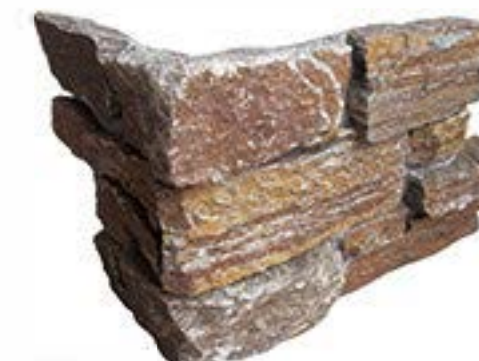
锈石英拐角 Rusly Quartz Corner