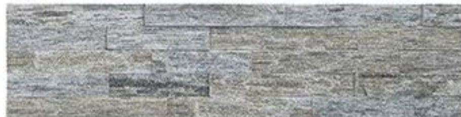
白木纹 White Wooden