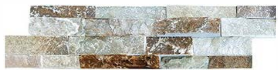
黄木纹 (平板+毛边) Yellow Wooden (Flat+Rough Edges)