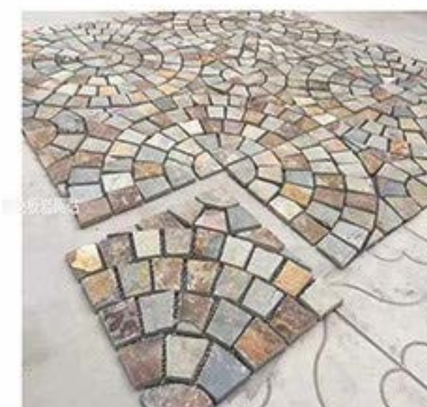
锈色正方形 Rusty Square