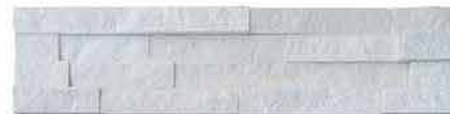
山东白 White Quartz