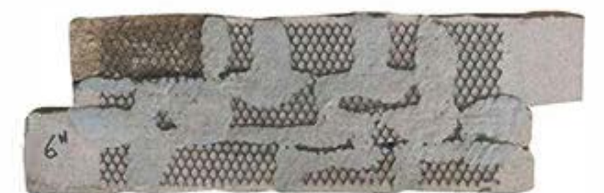
水泥侧粘文化石背面 Cement Side Paste Back