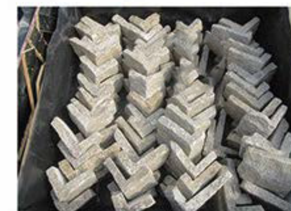
芝麻黄 (拐角) Sesame Yellow(Corner)