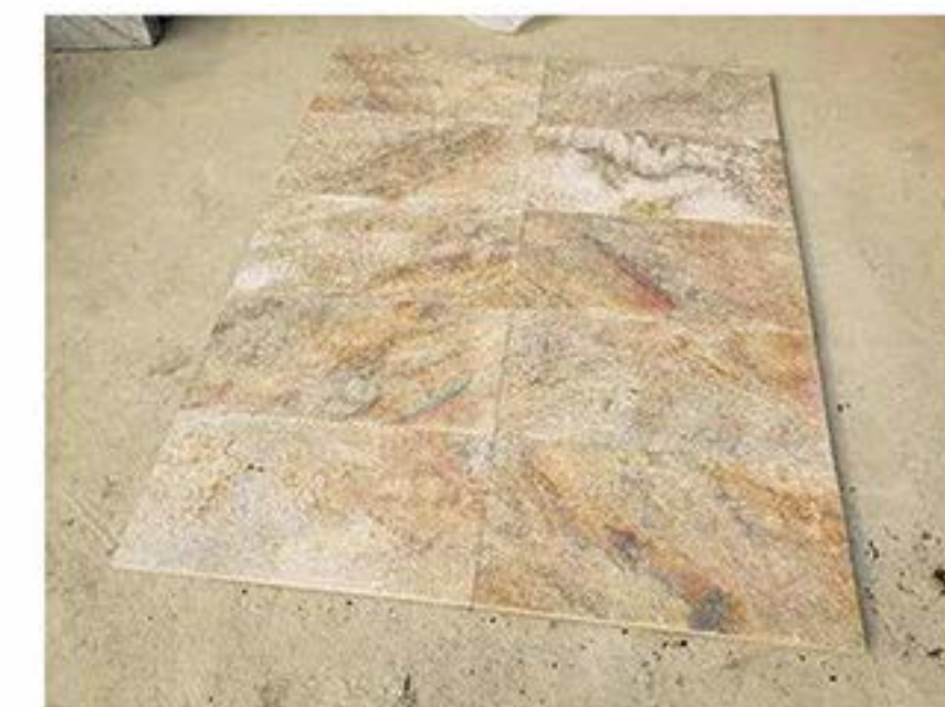
锈石英 (火烧面) Rusty Quartz (Flamed)