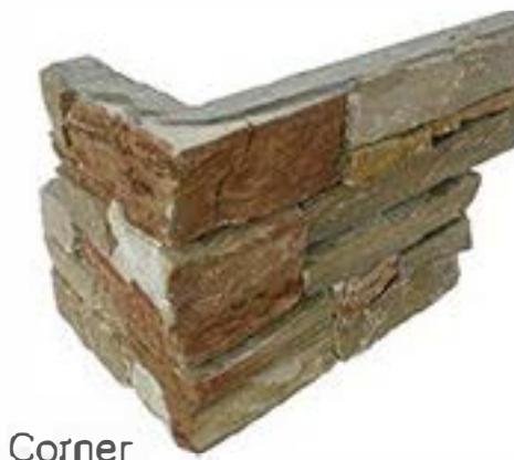
黄木纹拐角 Yellow Wooden Corner