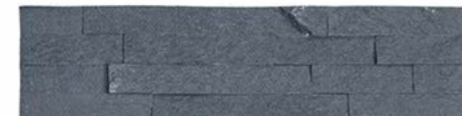
黑石英(洞矿) Black Quartz