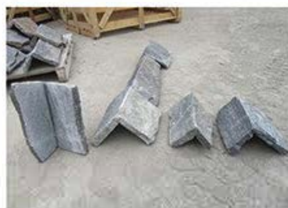
太行灰 (拐角) Taihang Grey (Corner)