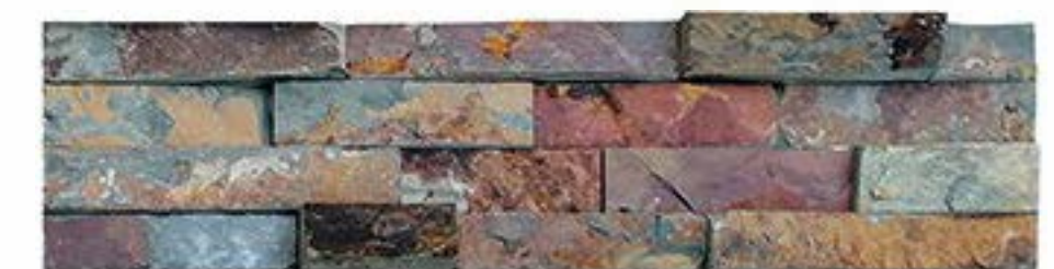
锈色 (平板+毛边) Rusty (Flat+Rough Edges)