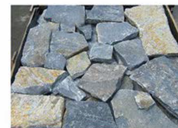
蓝石英 Blue Quartz