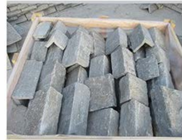
太行灰 (拐角) Taihang Grey(Corner)