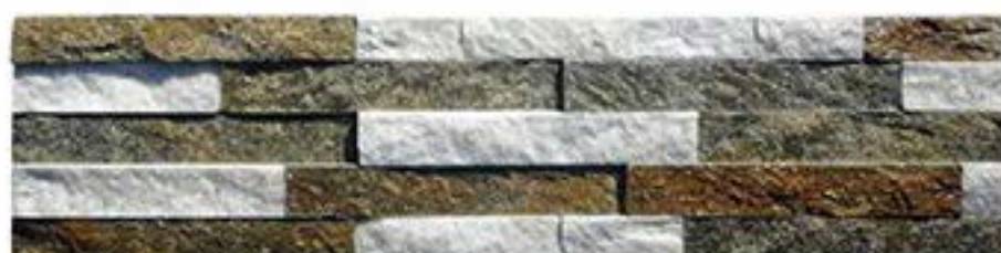
二色石英 2 Colors Quartz