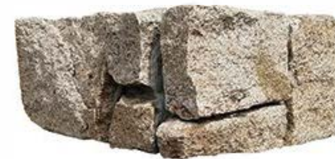
虎皮黄拐角 Tiger Skin Yellow Corner