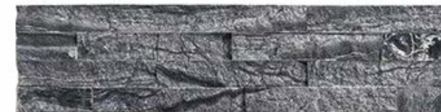
古木纹 Black Forest