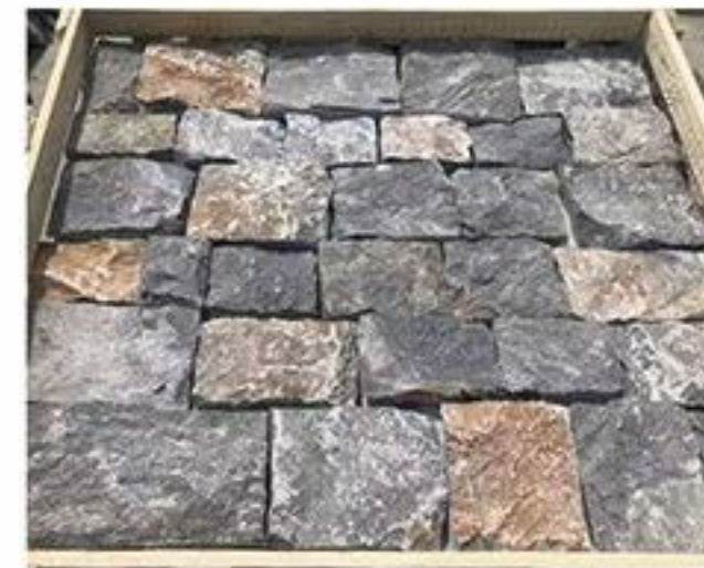
太行黑 + 锈城堡石 Taihang Grey+Rusty