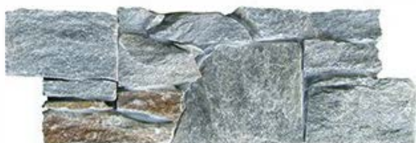
绿石英 Green Quartz