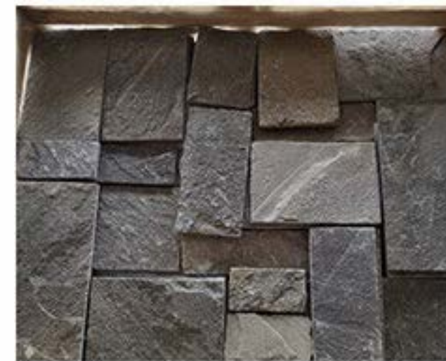
灰色板岩 Grey Slate