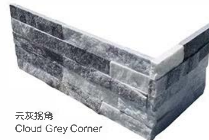
云灰拐角 Cloud Grey Corner