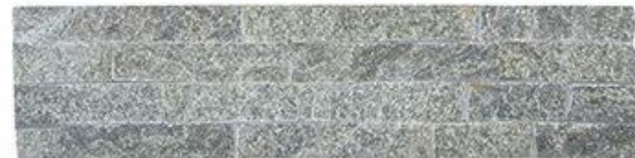
绿石英 Green Quartz