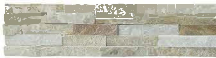
黄木纹 Yellow Wooden