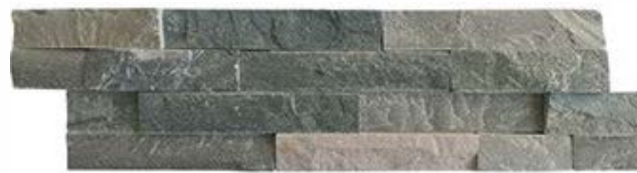
青白毛边 Blue and white Rough Edges