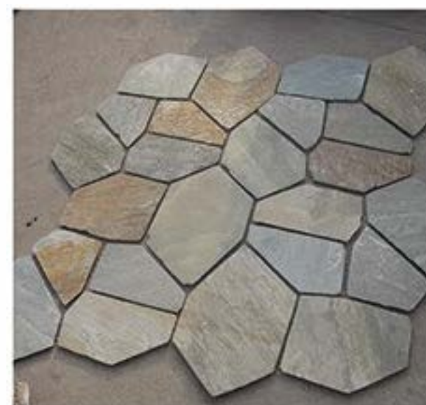
黄木纹 Yellow Wood