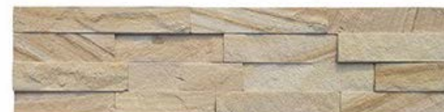
黄砂岩 Yellow Sandstone