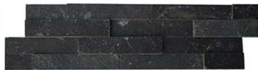
18 平板 Flat 18