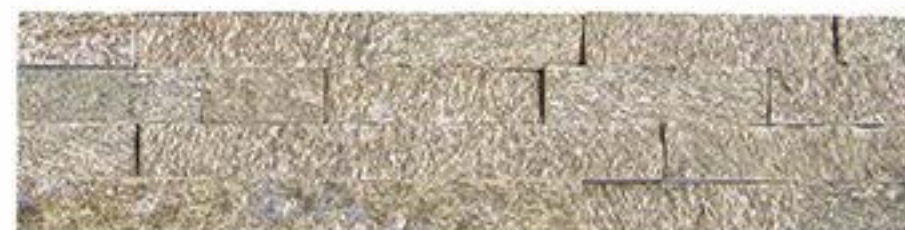
虎皮黄 Tiger Skin Yellow