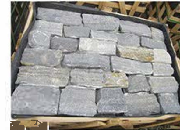
蓝石英 Blue Quartz