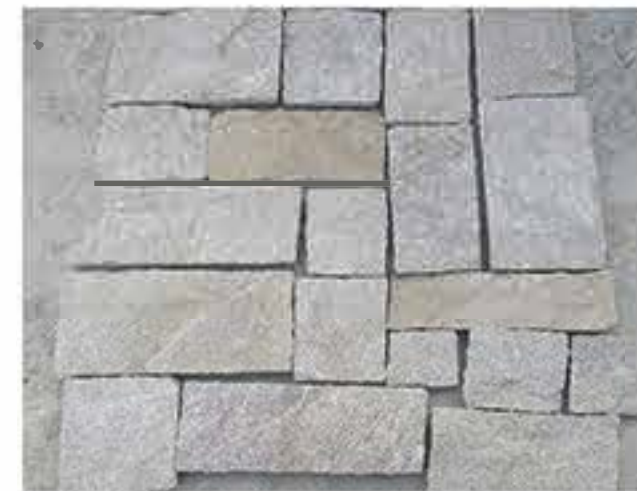
芝麻黄 Sesame Yellow