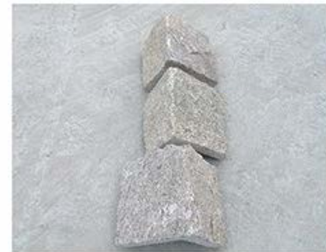
芝麻黄 (拐角) Sesame Yellow(Corner)