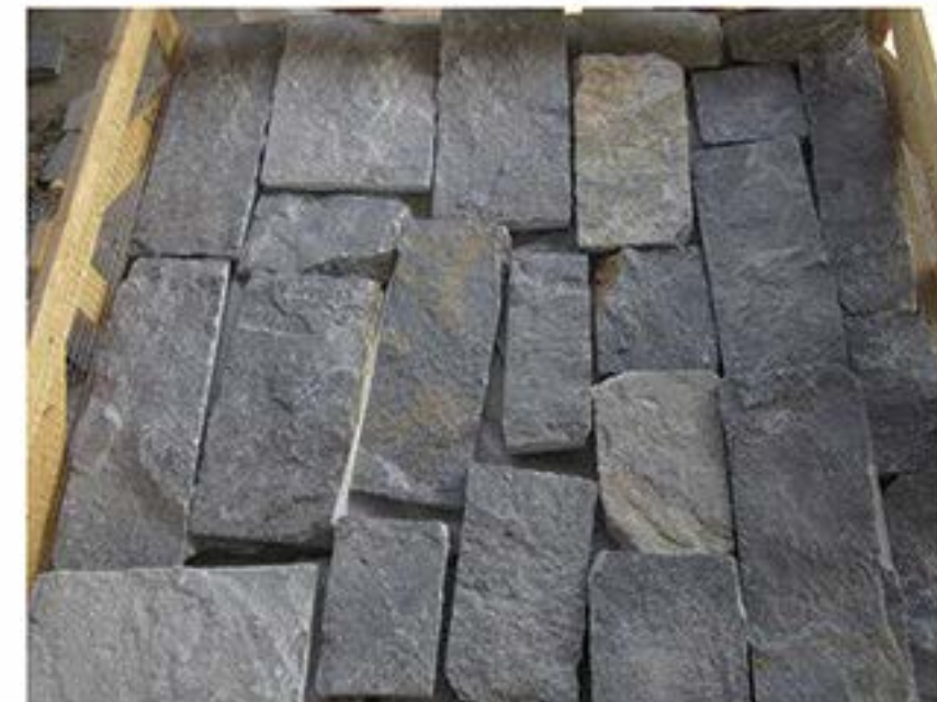
蓝石英 Blue Quartz