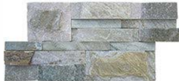
黄木纹 Yellow Wooden