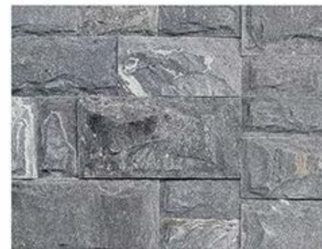
太行灰 蘑菇石 Taihang Grey (Mushroom Stone)