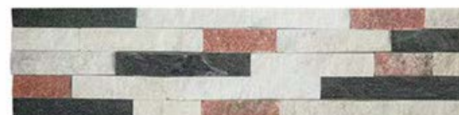
三色石英 3 Colors Quartz