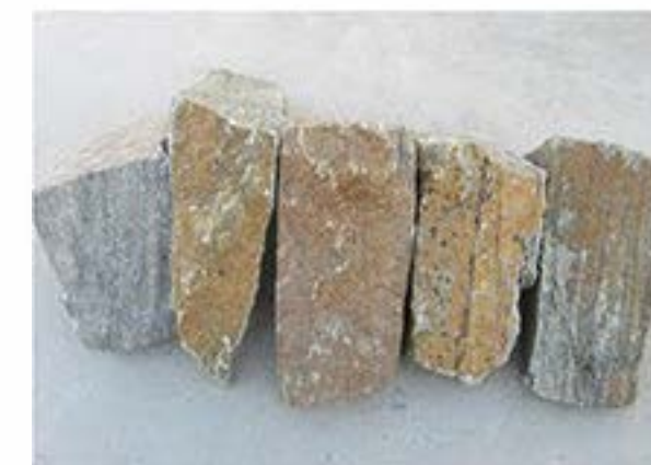
锈石英 (拐角) Rusty Quartz (Corner)