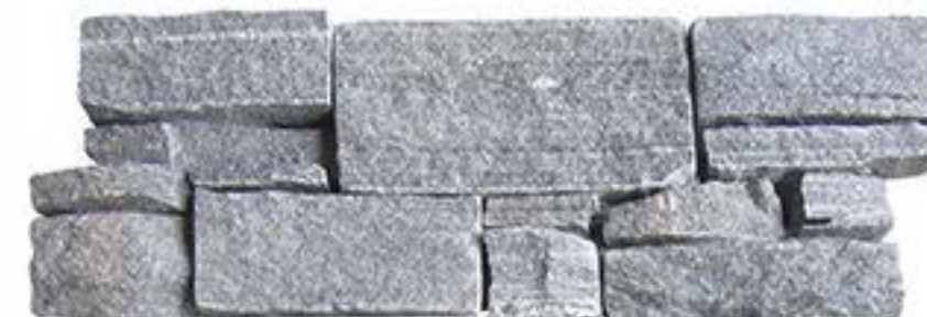
太行灰 Taihang Grey