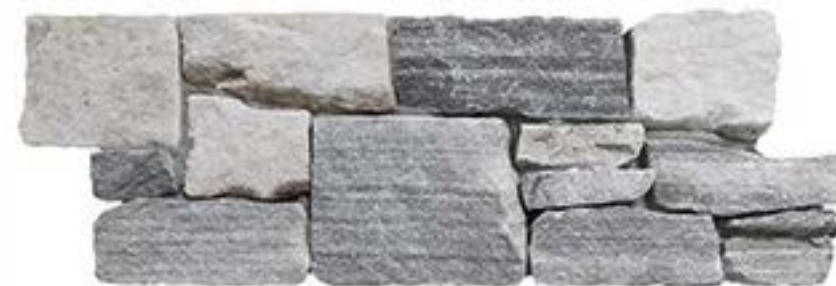
云灰 Cloud Grey