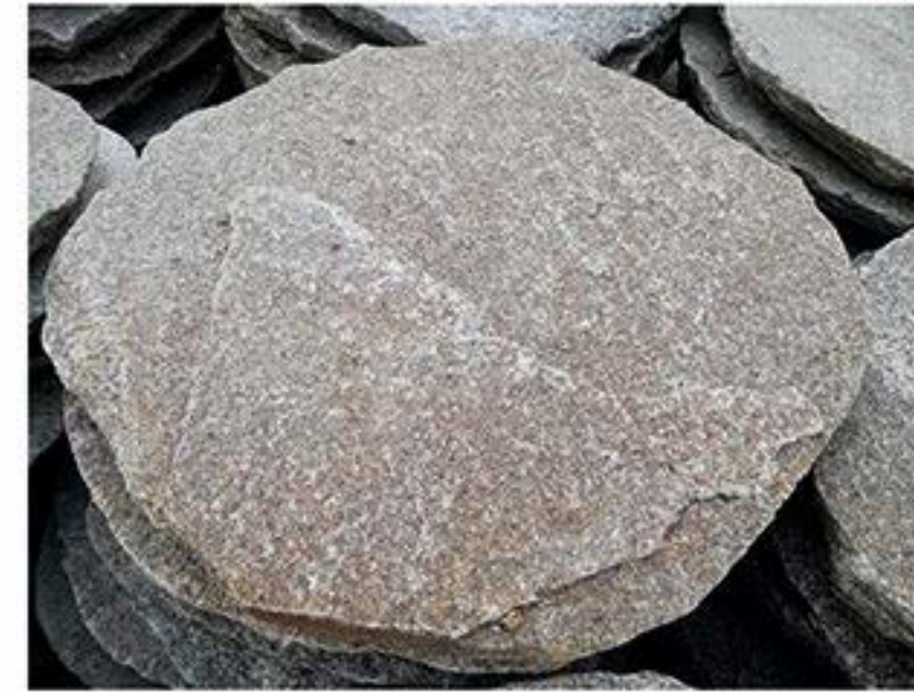
芝麻黄 Sesame Yellow