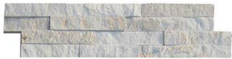
金丝白 Gold Silk White