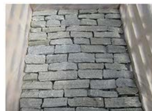
太行灰 Taihang Gray