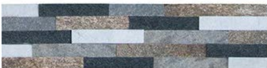
四色石英 4 Colors Quartz