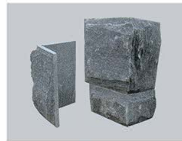
太行灰 蘑菇石 (拐角) Taihang Grey Mushroom Stone (Corner)