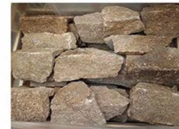
芝麻黄 (拐角) Sesame Yellow (Corner)