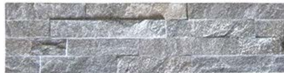
鱼鳞灰 Fish Scale Grey