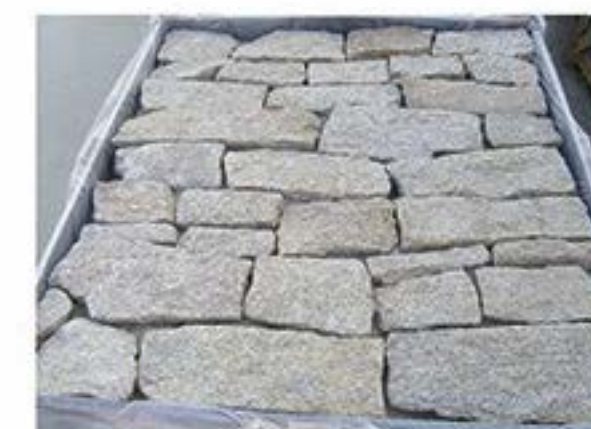
芝麻黄 Sesame Yellow