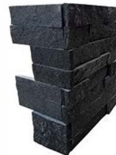
黑石英(洞矿)拐角 Black Quartz Corner