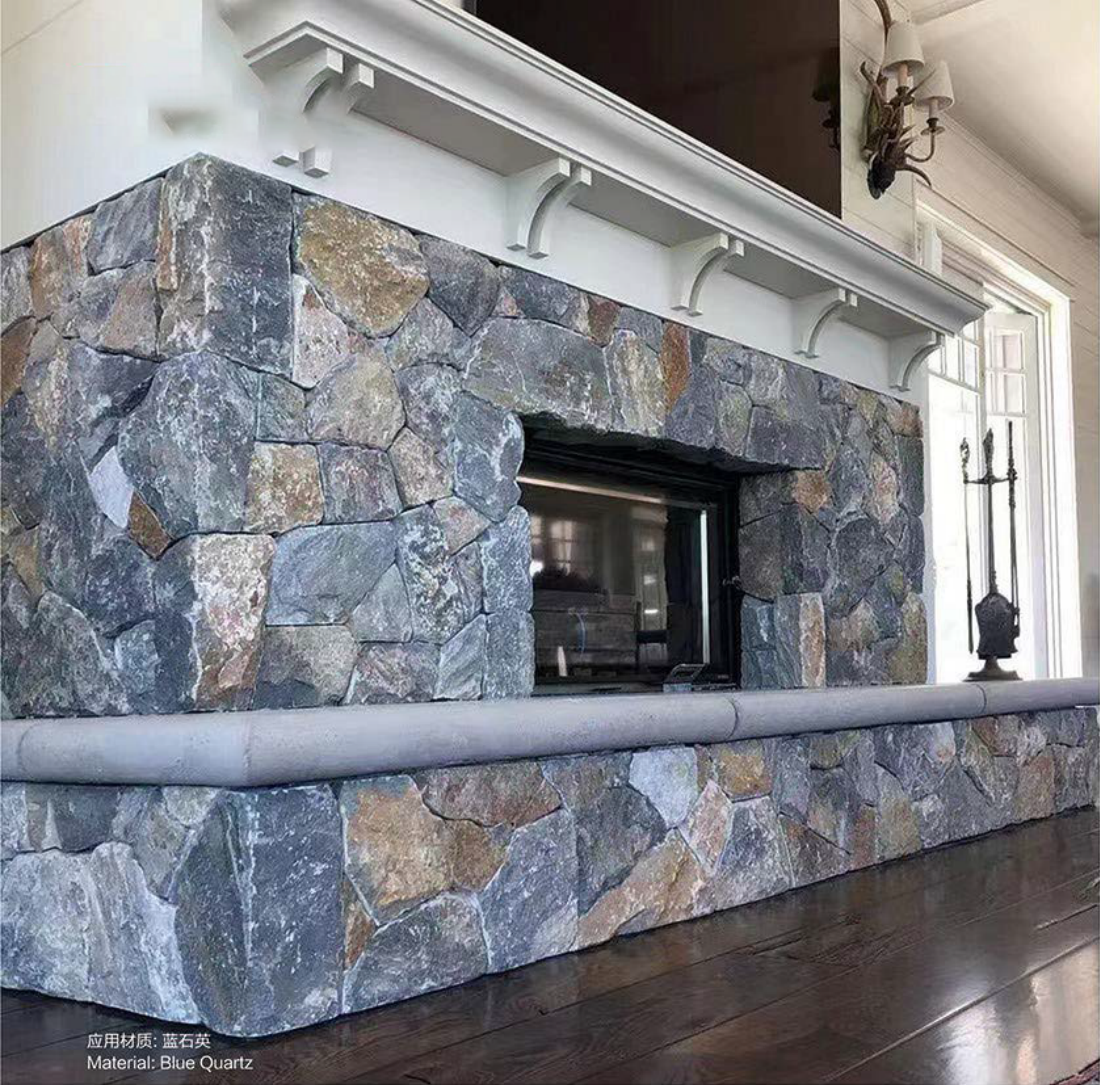
应用材质: 蓝石英 Material: Blue Quartz