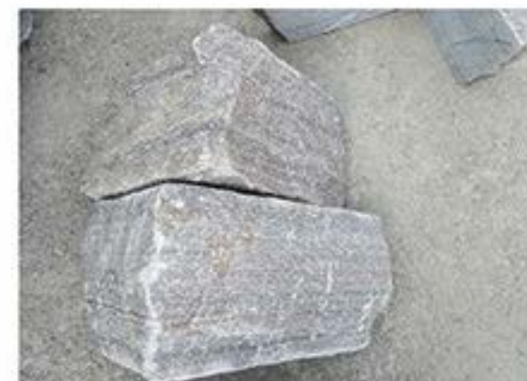
粉石英 (拐角) Pink Quartz(Corner)