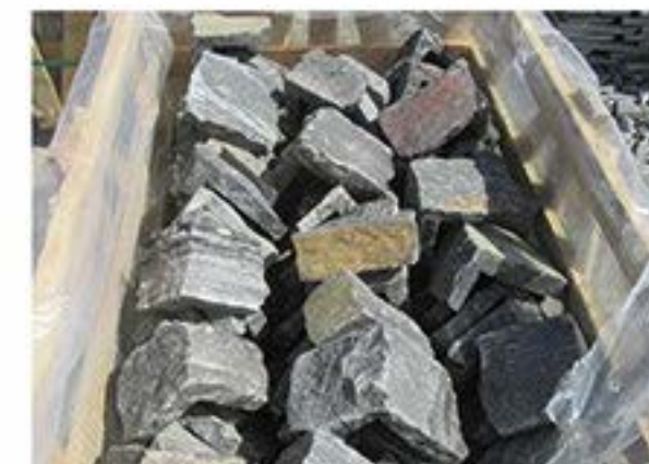
黑灰石英 (拐角) Black & Grey Quartz(Corner)