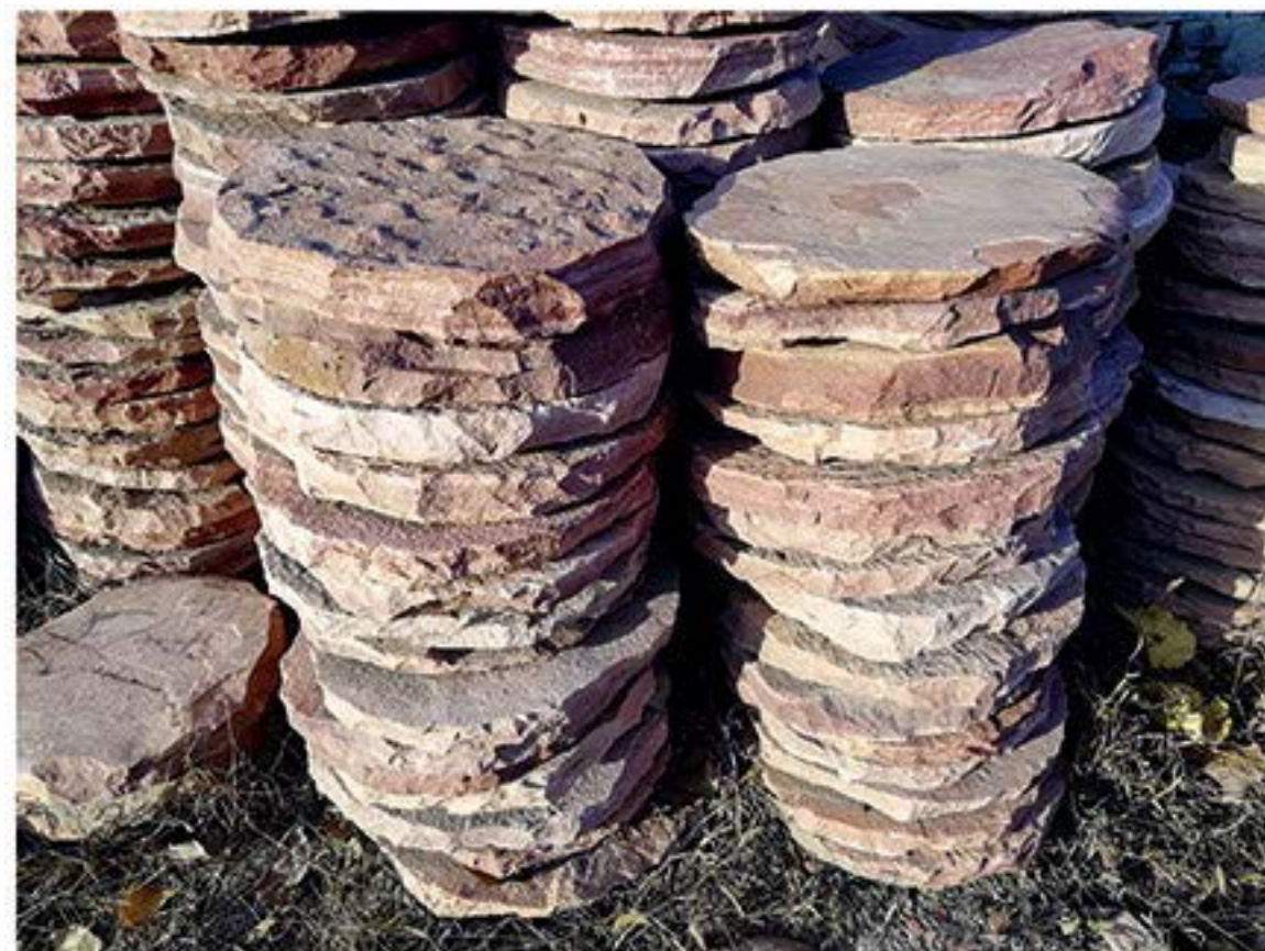
高粱红 Sorghum Red