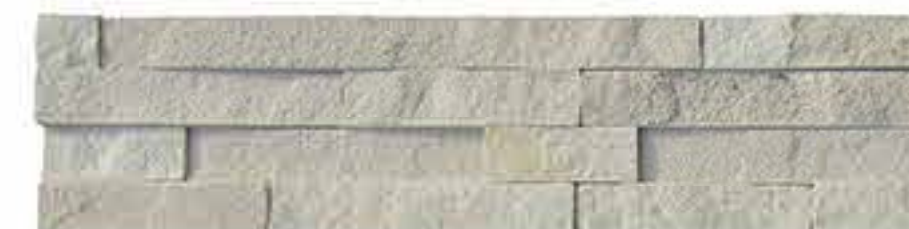
白砂岩 White Sandstone