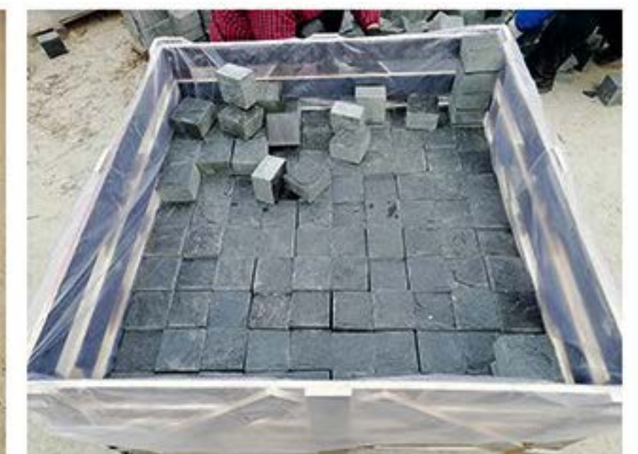
松针黑自然小方块 Pine Needle Black (Cube Stone)