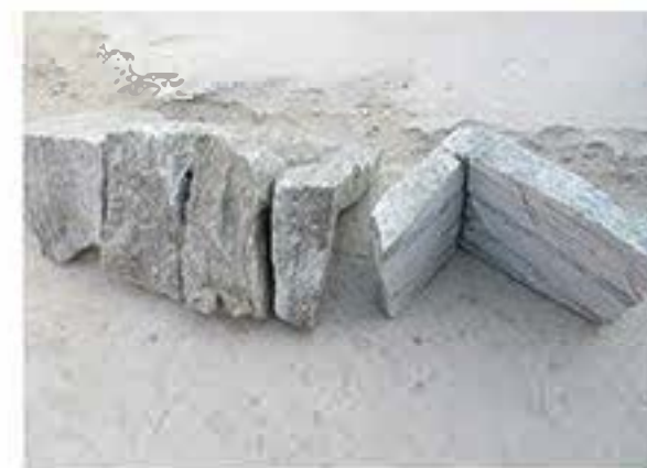
绿石英 (拐角) Green Quartz (Corner)