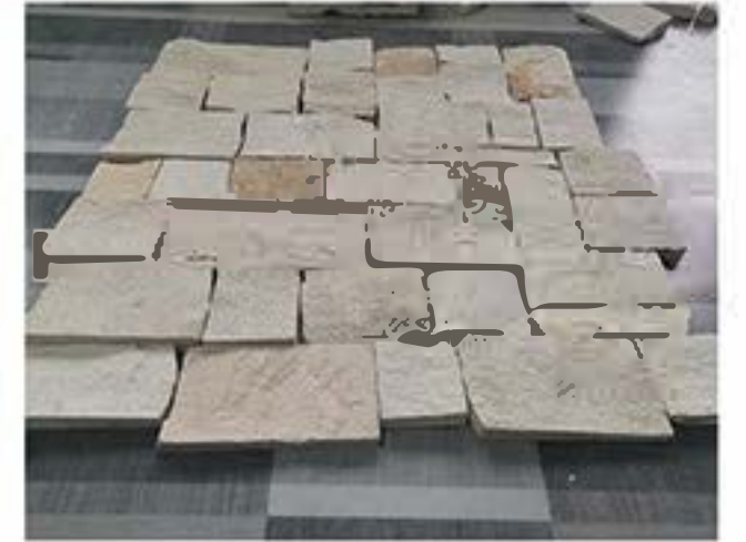
白砂岩条石 White Sandstone