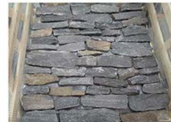
黑灰石英 Black & Grey Quartz