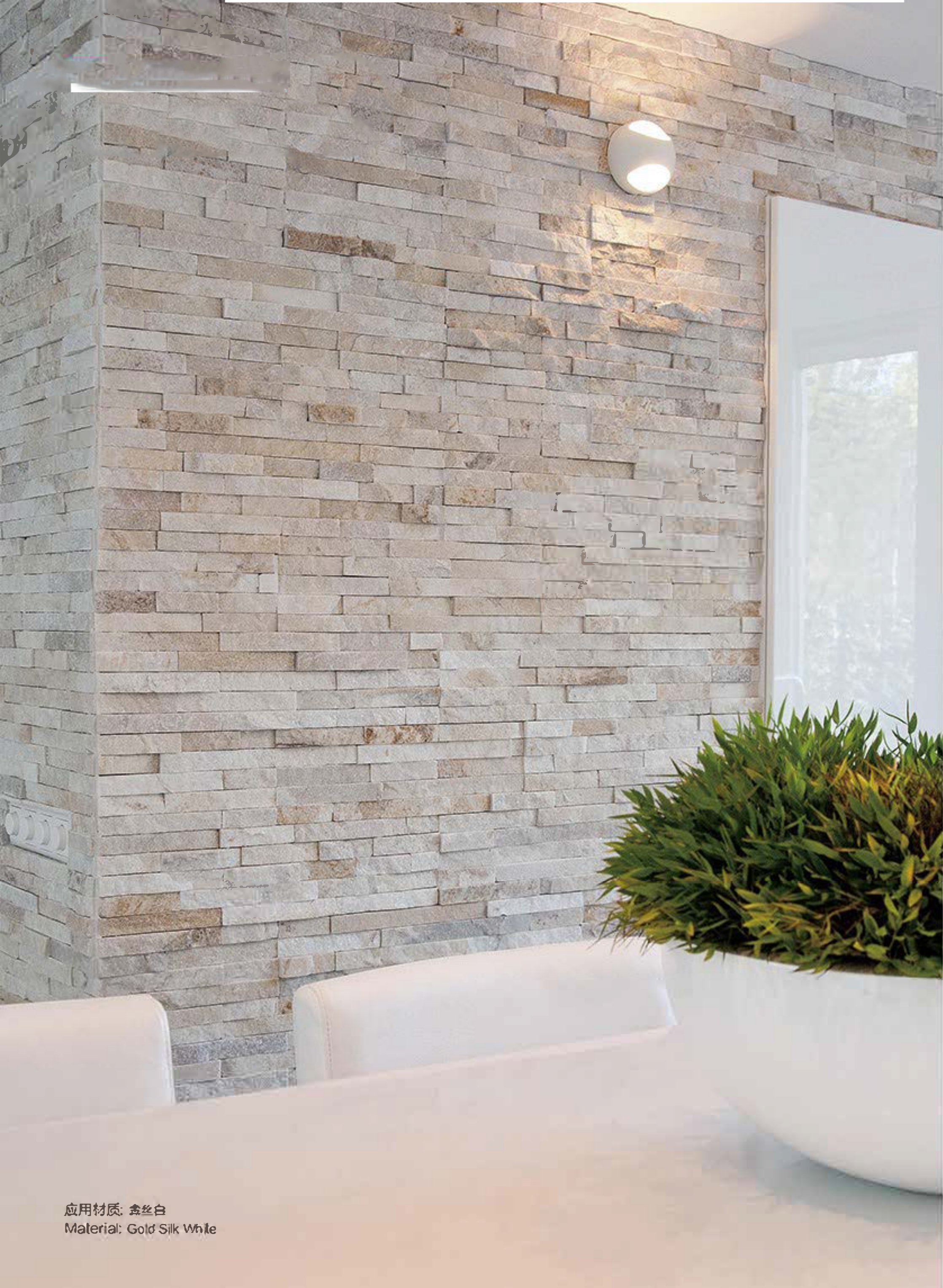
应用材质: 金丝白 Material: Gold Silk White