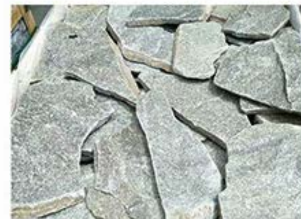
绿石英 Green Quartz