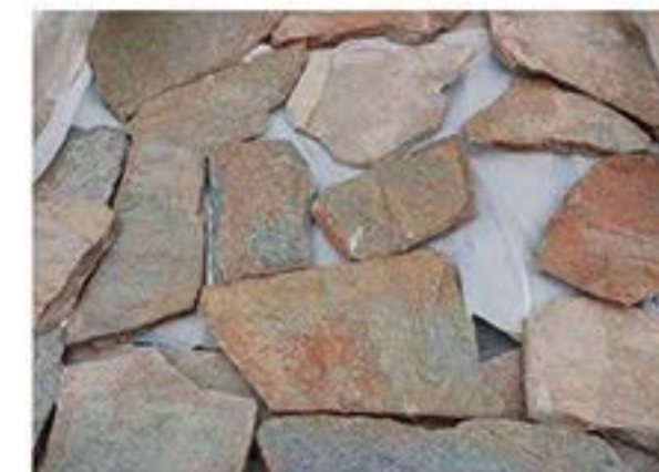
锈石英 Rusty Quartz