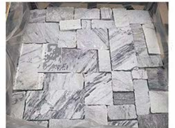
云灰城堡石 Cloud Grey