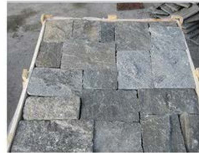
太行灰 Taihang Grey