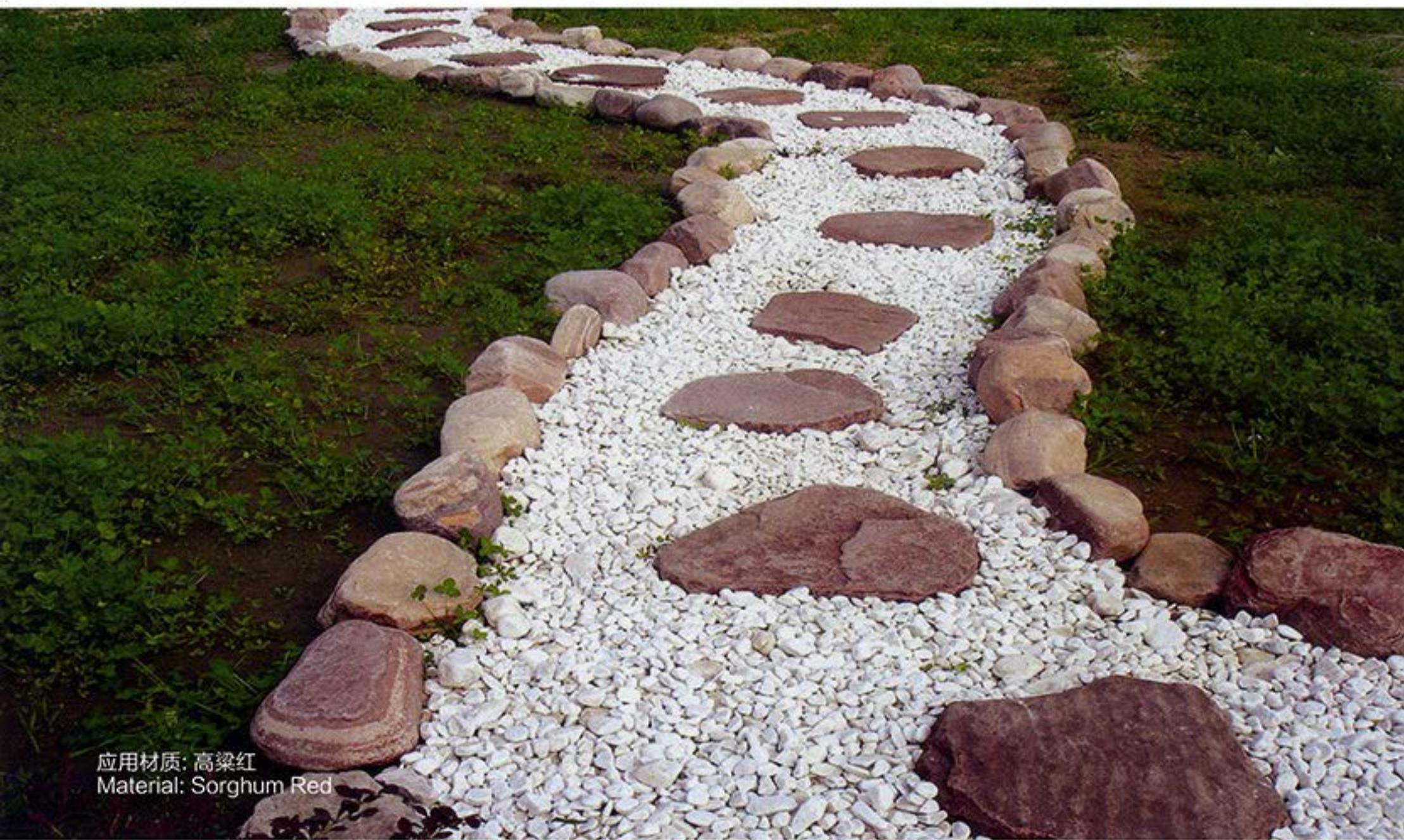
应用材质: 高粱红 Material: Sorghum Red