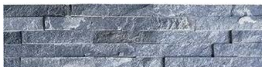
蓝石英 Blue Quartz