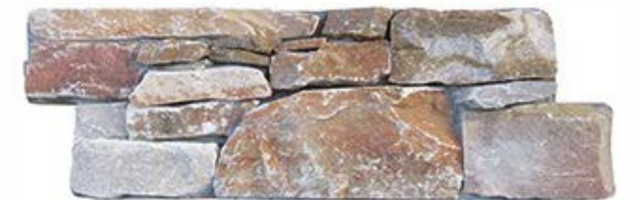
黄木纹 Yellow Wooden