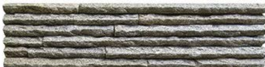
芝麻黄山峰石 Sesame Yellow Mountain