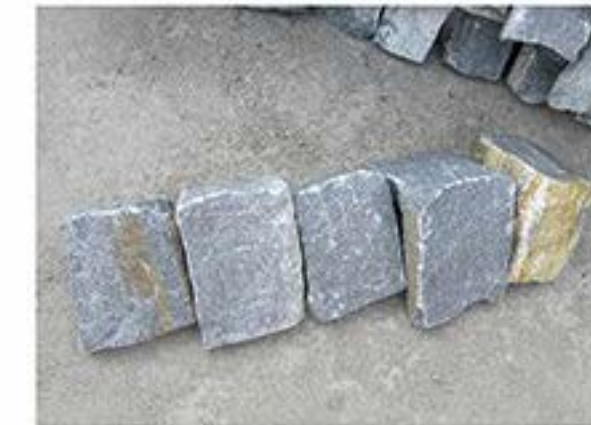
蓝石英 Blue Quartz(Corner)