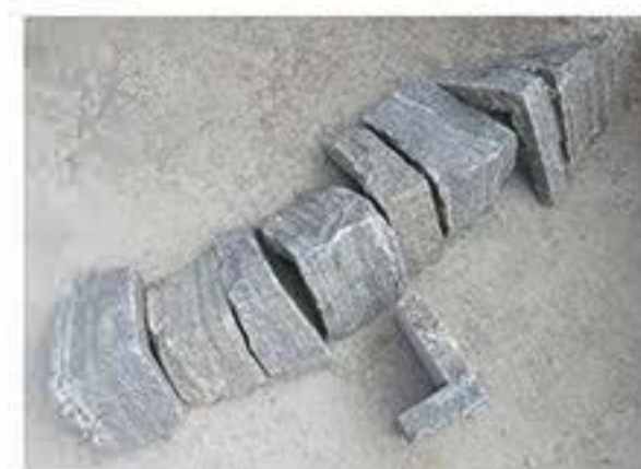
太行灰 (拐角) Taihang Grey(Corner)