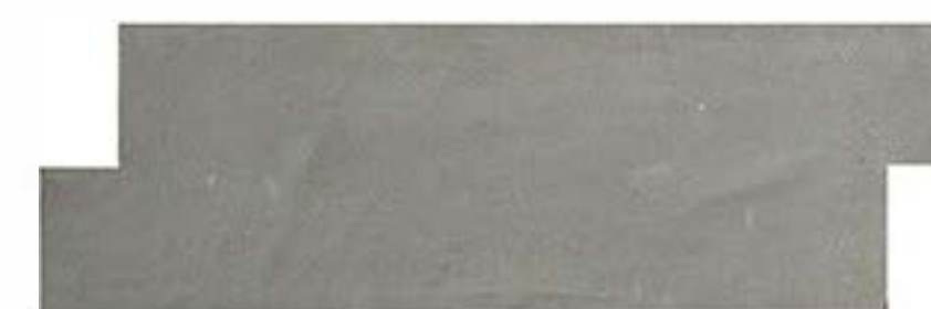
水泥文化石背面 Cement Back