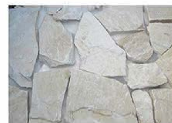
黄白石英 Light Yellow Quartz