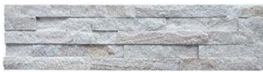
金线木纹 Gold Thread Wood Grain