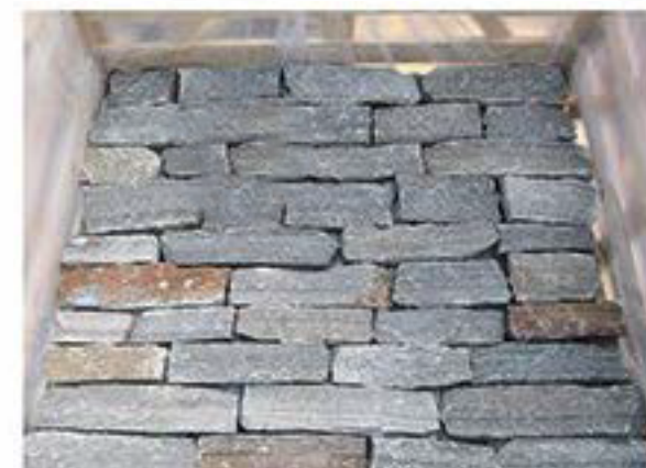
粉石英 Pink Quartz