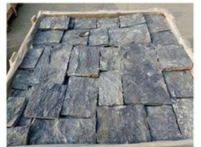
太行黑城堡石 Taihang Black