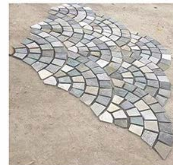
混色小扇形 Mixed Color Small fan-shaped