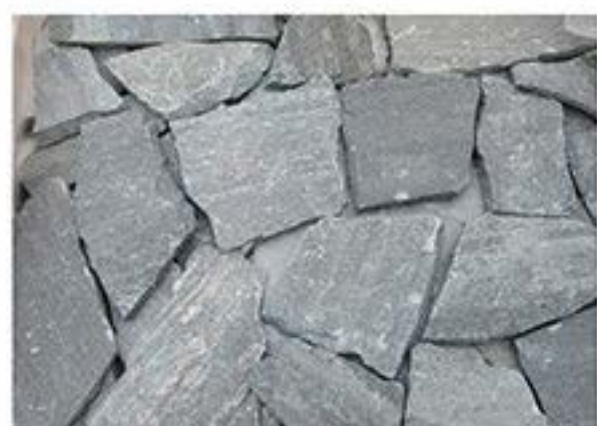
太行灰 Taihang Grey