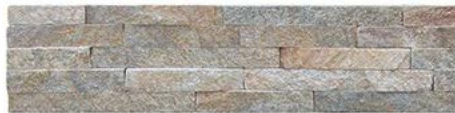
锈石英 Rusty Quartz