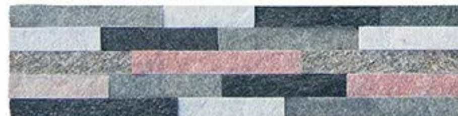
五色石英 5 Colors Quartz