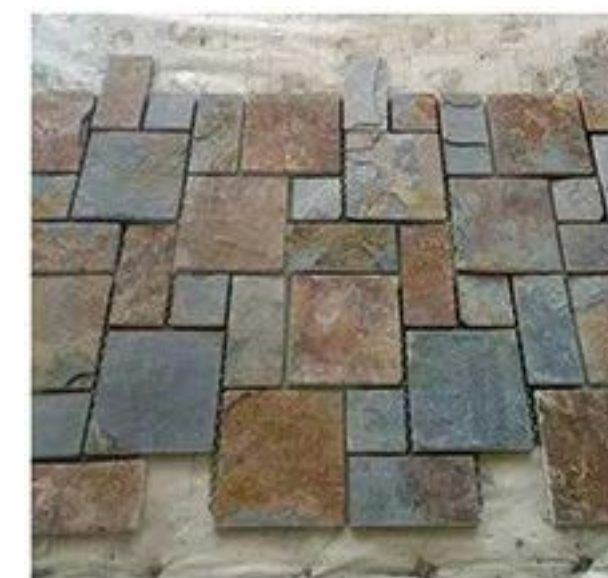
锈色不规则 Rusty Irregular