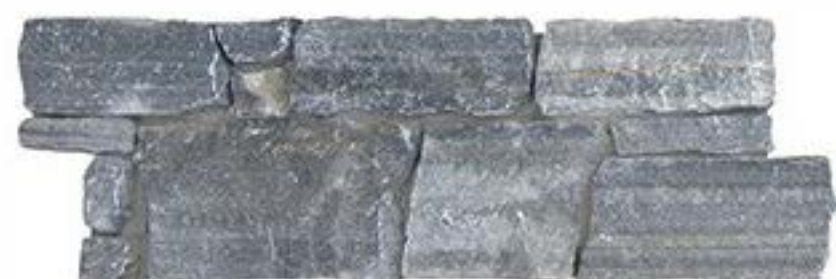
蓝石英 Blue Quartz