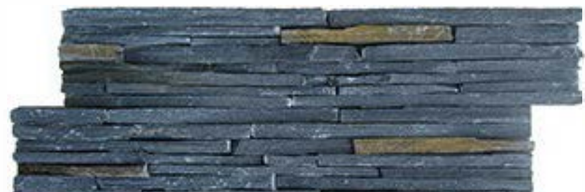
TS 黑色 + 锈 TS Black + Rusty