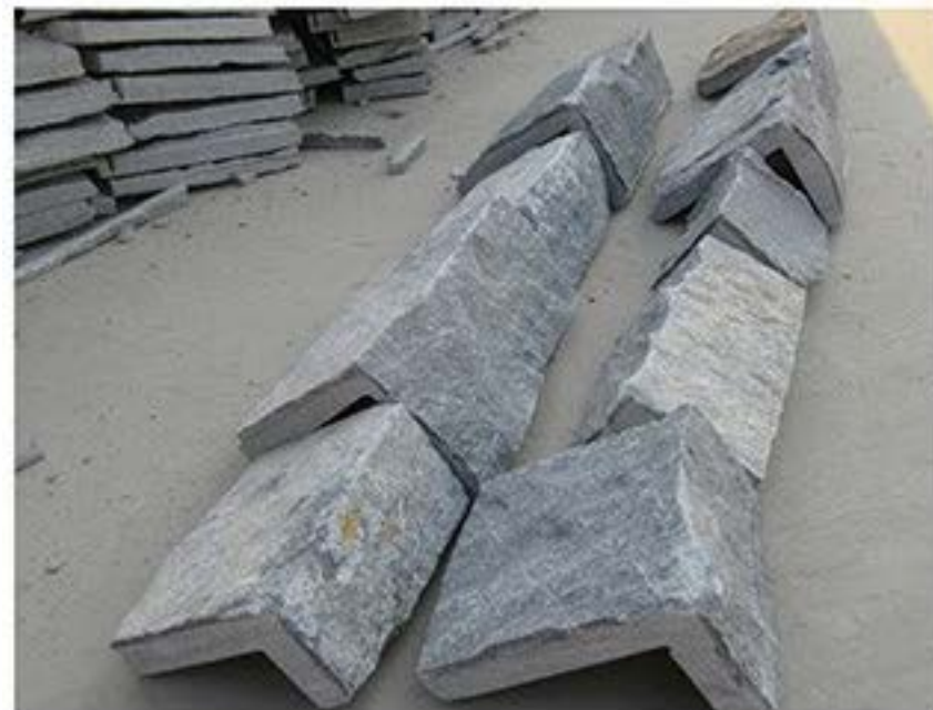
蓝石英 (拐角) Blue Quartz(Corner)