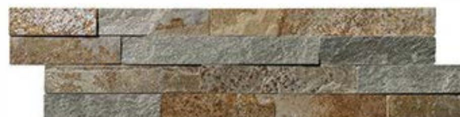
满天星 Many Stars